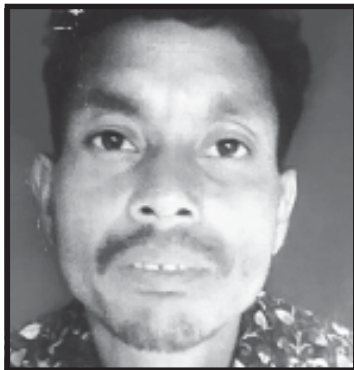
Sri Diplal Paraja Bhitarbagri, Block : Dashmantapur , Koraput

Bhitarbagri is at a distance of 20 kms from the district headquarter. 170 families live in this village. Out of this 161 families are tribals and rest are from other communities. The main occupation is agriculture and daily wage. Since 2014, there has been a big change in social, economical condition and also in health and niutrition. In 2014. Then the EU project was started. The project was aimed at creating awareness about government programmes and Palli Sabha and Gram Sabha.