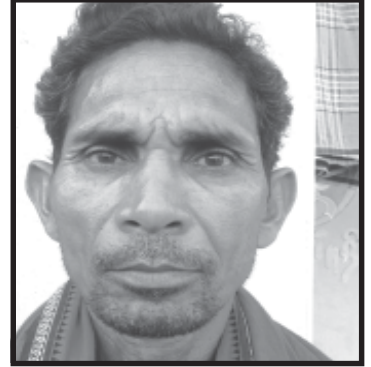
ସମ୍ବାରୁ ଗହ୍ନିର ଗ୍ରାମ : ସୁଆଁବାହାଲ, ପଂଚାୟତ : କନୁଟ, ବ୍ଲକ୍ : ବେଲପଡ଼ା, ଜିଲ୍ଲା : ବଲାଙ୍ଗିର

ଆମ ଗ୍ରାମରେ ମନରେଗା ଆଇନ ଦ୍ୱାରା ଏଠାର ପ୍ରଥମ କରି ଶ୍ରମିକଦଳ ଗଠିତ ହୋଇଛି । ଓଡ଼ିଶାରେ ଏହି ଗ୍ରାମରେ ପ୍ରଥମ କରି ମନରେଗା ଅଣସଂଗଠିତ ଶ୍ରମିକ ଦଳ ଗଠିତ ହୋଇଛି । ଦଳଗଠନ ହେବା ଦ୍ୱାରା ଆମର ସାହସ ବଢ଼ିଲା ଏବଂ ଆମେ ଗ୍ରାମ ପଂଚାୟତ, ବ୍ଲକ୍‌କୁ ଯାଇ ଦାବୀ କରି ମନରେଗାରେ ଆମର ନ୍ୟାୟ ଦାବୀ ପାଇପାରିଛୁ । ଆମ ଦଳରେ ଆମେ ନିୟମିତ ସଂରକ୍ଷଣ କରି ବର୍ତ୍ତମାନ ସୁଧା ୧୫,୦୦୦ ଟଙ୍କା ବ୍ୟାଙ୍କରେ ଜମା କରିପାରିଛୁ । ଆଗାମୀ ଭବିଷ୍ୟତରେ ଉଚ୍ଚ ଟଙ୍କାକୁ ଅସୁବିଧା ସମୟରେ ବ୍ୟବହାର କରିବା ସହିତ ରୋଜଗାର କରିବା ପାଇଁ ବ୍ୟବହାର କରିବୁ । ଏଣୁ ଶ୍ରମିକ ଦଳ ଦ୍ୱାରା ଆମ ଗାଁ, ଆମ ଶ୍ରମିକମାନଙ୍କର ଉପକାର ହୋଇପାରିଛି । ଏହି ଗ୍ରାମର ଶ୍ରମିକଦଳ ଗଠନକୁ ଦେଖି ମରିବାହାଲ, କନୁଟ, ପଦ୍ମପୁର ଆଦି ନିକଟସ୍ଥ ଗ୍ରାମରେ ମଧ୍ୟ ଗ୍ରାମବାସୀ ମନରେଗା ଶ୍ରମିକ ଦଳ ଗଠନ କରିଛନ୍ତି । ବିଭିନ୍ନ ସମୟରେ ଶ୍ରମିକମାନେ ଏକାଠି ହେବା, ସରକାରୀ ଯୋଜନା ସମ୍ପର୍କରେ ସୂଚନା ପହଞ୍ଚିବା ଦ୍ୱାରା ଏହା ସମ୍ଭବ ହୋଇପାରିଛି । ଶ୍ରମିକ ଦଳ ଗଠନ ଏବଂ ଏହାକୁ ସକ୍ଷାୟ କରିଥିବା ବଲାଙ୍ଗିର ବିକାଶ ପରିଷଦ ସଂସ୍ଥା ତଥା ଇ.ୟୁ. ଅଗ୍ରଗାମୀ ସୂଚନା ପ୍ରକଳ୍ପକୁ ମୁଁ ଧନ୍ୟବାଦ ଜଣାଉଛି ।