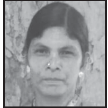
ବେନାରୀ କହିଁର ଗ୍ରାମ: ସେନିଗୁଡ଼ା, ପଂଚାୟତ : ପାଇରାକୁ, ବ୍ଲକ୍ : ଫିରିଙ୍ଗିଆ

ଗ୍ରାମର ମାଆମାନଙ୍କ ପାଇଁ କାମ କରିବାକୁ ମାଆମାନେ ଓଡ଼ିଶାମେସର ଭାବରେ ନିର୍ବାଚନ ଲଢ଼ିବା ପାଇଁ କହିଲେ । ମୁଁ ଓଡ଼ିଶାମେସର ୨୦୧୭ ନିର୍ବାଚନରେ ନିର୍ବାଚିତ ହୋଇଛି । ବର୍ତ୍ତମାନ ଓଡ଼ିଶାମେସର ଓ ନାଗରିକ ସଚେତକ ମଂଚର ସଭ୍ୟା ହିସାବରେ ପଂଚାୟତ ସ୍ତରୀୟ ମଦ ବନ୍ଦ ଅଭିଯାନରେ ଭାଗ ନେଇ ପଂଚାୟତରେ ଆନ୍ଦୋଳନ ଜାରି ରଖୁଛି । ମାଆମାନଙ୍କର ସମସ୍ୟା ସମ୍ପର୍କରେ ଏକାଠି ହୋଇ ଆଲୋଚନା କରୁଛି ଏବଂ ସମସ୍ୟା ସମାଧାନ କରିବା ପାଇଁ ପ୍ରୟାସ କରୁଛି ।