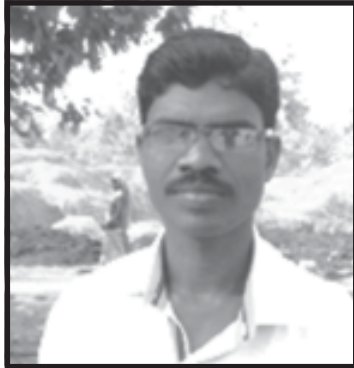
Era Padiami panchayat : Gorakhuta, block : Korkonda , Malkangiri.

I was born in a Koya family. After failing in class X, I went away as a migrant labour. I worked hard in Hyderabad. I was a bonded labour and worked on daily wage. But I realized that the reasons for backwardness of the Koyas are lack of education, lack of awareness and government programmes not reaching the people.