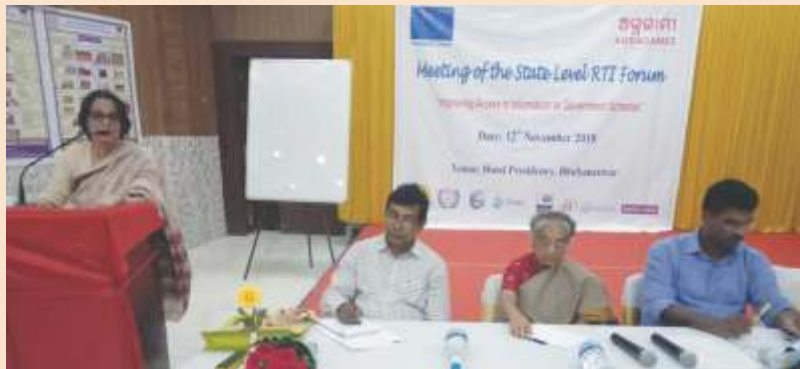
ସୂଚନା ଅଧିକାର କମିଶନର ସଦସ୍ୟା ଶ୍ରୀମତୀ ଶଶିରେଖା ବିହାରୀ ରାଜ୍ୟସ୍ତରୀୟ ସୂଚନା ଅଧିକାର ମଂଚ ବୈଠକରେ ଉଦ୍‌ବୋଧନ ଦେଉଛନ୍ତି