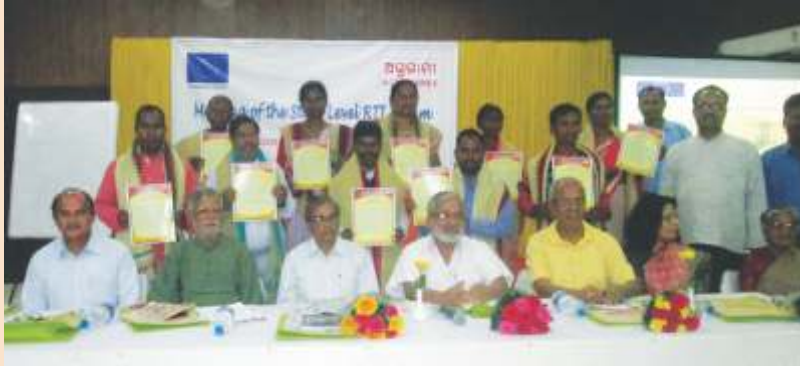
ରାଜ୍ୟସ୍ତରୀୟ ସୂଚନା ମଂଚ ଅଧିବେଶନରେ ୧୦ଟି ଜିଲ୍ଲାରୁ ସମ୍ମାନିତ ହୋଇଥିବା ନାଗରିକ ଚେତନା ମଂଚର ସଦସ୍ୟାଙ୍କ ସମ୍ମାନିତ